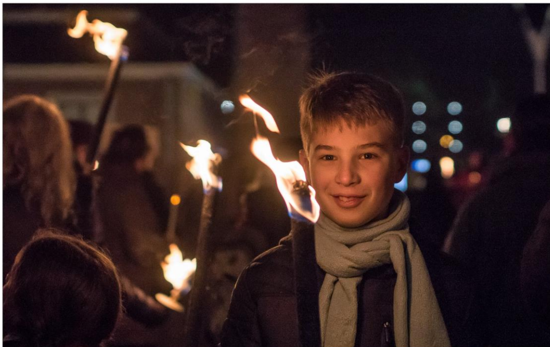
Vredeswandeling Sant'Egidio 2020